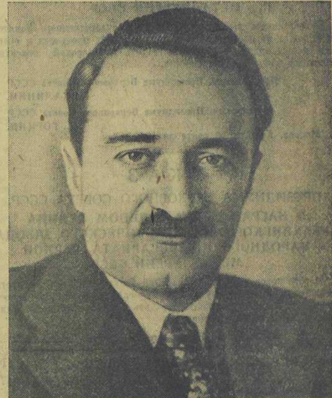
Герой Социалистического Труда А. И. Микоян